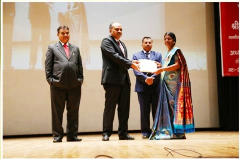
Recognition by KVS for Outstanding Services